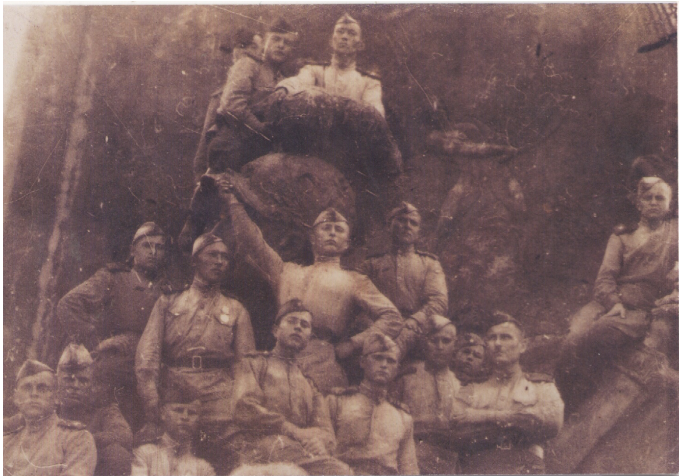
Май 1945 года Берлин

По окончании войны 5 месяцев служил в Берлине, затем еще 5 лет в разных городах Германии. В этот период окончил курсы младших командиров, затем служил химмастером полка по штабу. И, спустя месяц, поехал в город Бирск поступать в медтехникум. Видел много смертей, поэтому выбрал самую мирную профессию. В 1953 году вернулся на свою малую родину фельдшером-акушером и не изменял этой профессии всю свою жизнь, посвятив медицине 50 лет. За долголетний безупречный труд 2 раза был награжден грамотами Верховного Совета Башкирской АССР, каждый год грамотами районной больницы ,медалью «Ветеран труда».