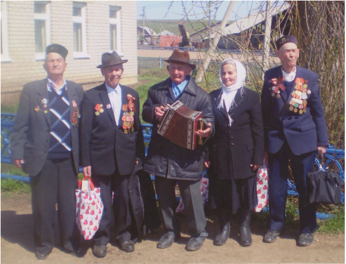
9 мая встреча Ветеранов

У него дружная многодетная семья. С супругой, с которой прожили более 55 лет, они воспитали и дали хорошее образование шестерым детям. Я преклоняюсь перед такими героями. Мы, школьники мирного времени, не хотим войны. Жизнь человеку дана для того, чтобы строить светлое будущее. Память о таких героях надолго останется в наших сердцах.