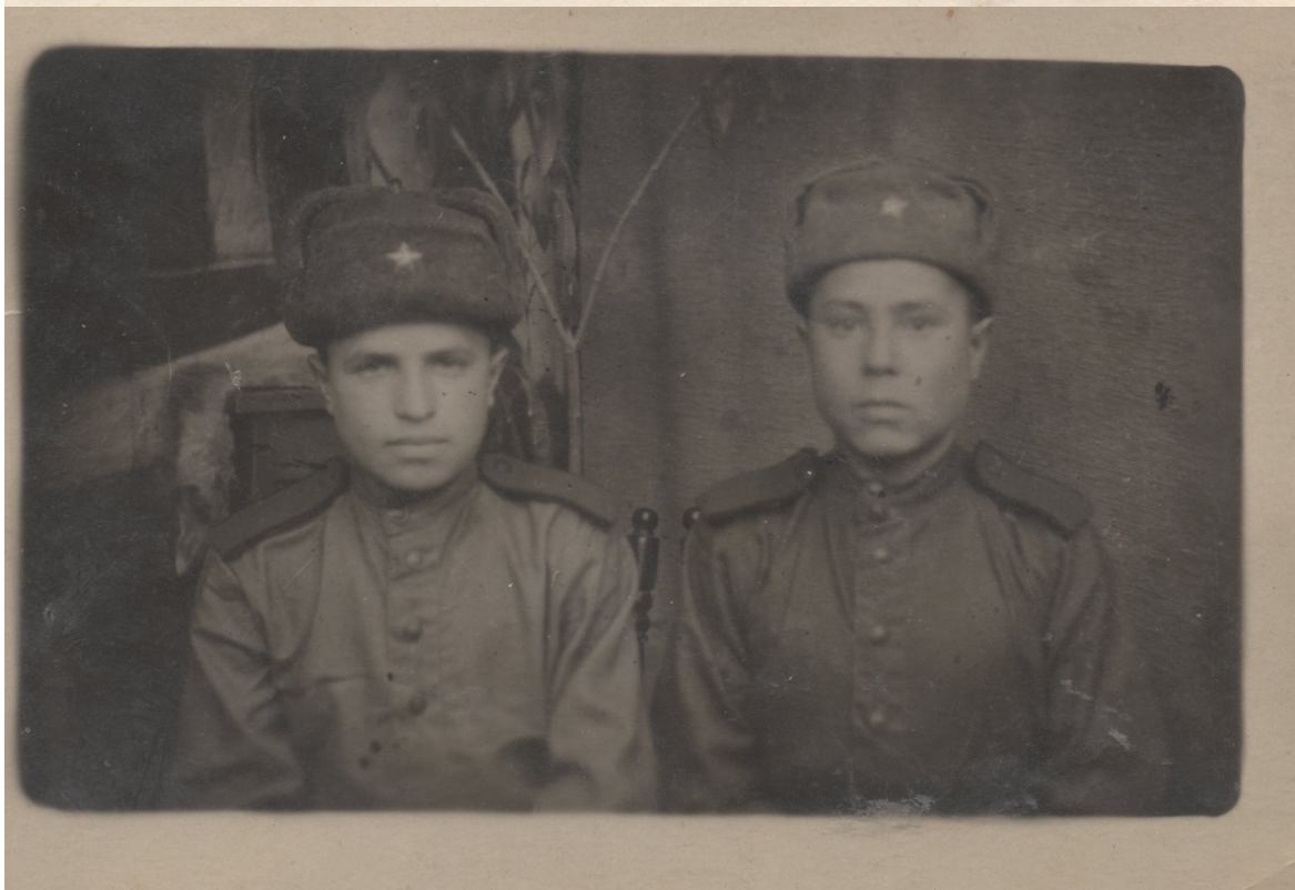
Фото с фронта